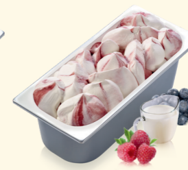
Joghurt- Waldf Frucht mit Waldfruchtsauce