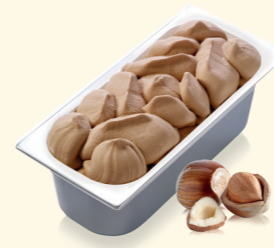
Haselnuss mit knackigen Haselnussstückchen