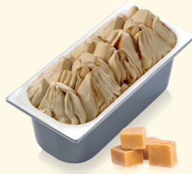
Dulce de Leche Milch Karamell mit Karamellsauce