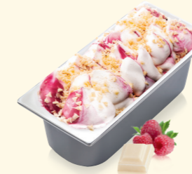
Weiße Schokolade- Himbeere mit weißen Schokostückchen