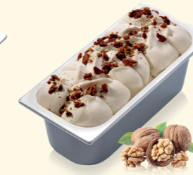
Walnuss mit Walnussstückchen