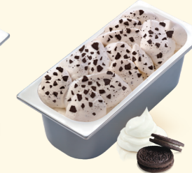
Cookies & Cream Cremiges Eis mit Obersgeschmack und vielen saftigen Keksstückchen