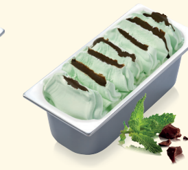
Minz Crunch mit knackiger Knusperschicht