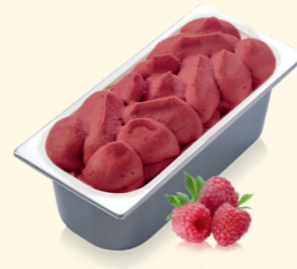
Sorbet Himbeer mit Himbeerstückchen