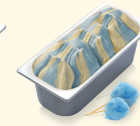
Blaue Zuckerwatte mit Zuckerwatte-Geschmack