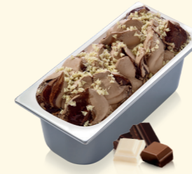
Triple Choc mit Schokoladensauce und weißen Schokostückchen