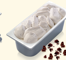
Stracciatella mit zartschmelzenden Milchschokoladenstückchen