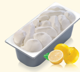
Sorbet Zitrone mit Zitronensaft