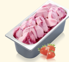
Erdbeer mit Erdbeersauce und -stückchen