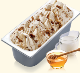
Griechisches Joghurt mit Honigsauce und karamellisierten Walnüssen