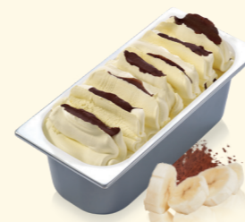
Banana Crunch mit Knusperschichten