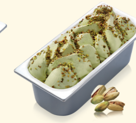
Pistazie mit Pistazienstückchen