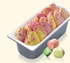
Bubble Gum Marshmallow mit Marshmallow-Stückchen