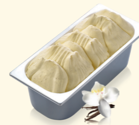
Vanille mit vermahlenden Vanilleschoten