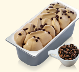
Café mit knusprigen Kaffeeschokobohnen